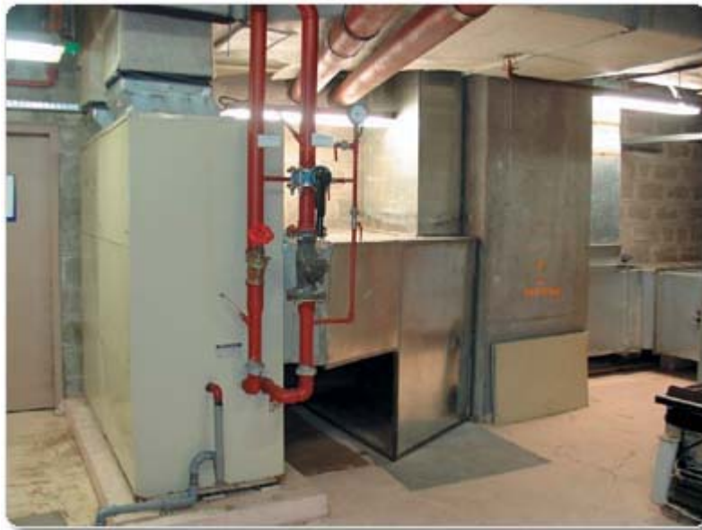
Рисунок 7. Тепловой насос и система вентиляции конференц-зала

Рассмотрим теперь уже упомянутый случай с вентиляцией отдела прачечной. Воздух, удаляемый из сушильных и стиральных машин и другого оборудования, после очистки до требуемых экологических норм выбрасывается наружу. Часть воздуха из помещений прачечной забирается и подается к тепловому насосу. На входе теплового насоса он смешивается с большим количеством свежего воздуха, нагретого в зимнее время до 12 °С. Смешанный воздух фильтруется, охлаждается тепловым насосом до 6–10 °С и подается в помещения прачечной. Тепло забирается водой контура и может быть использовано в тех местах, где его не хватает.