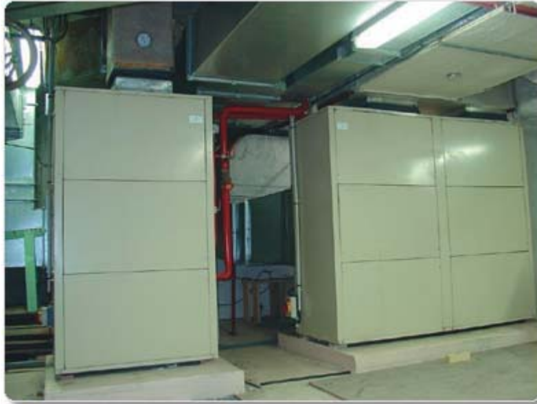
Рисунок 5. Напольные тепловые насосы большой производительности

Гостиница расположена на севере Москвы, на Коровинском шоссе. 8-этажное здание включает в себя 195 номеров разного класса и вместимости, два ресторана, бар, фитнес-центр с тренажерным залом, бассейном и саунами, 10 залов для конференций и банкетов, вмещающих до 300 человек, подземную автостоянку.