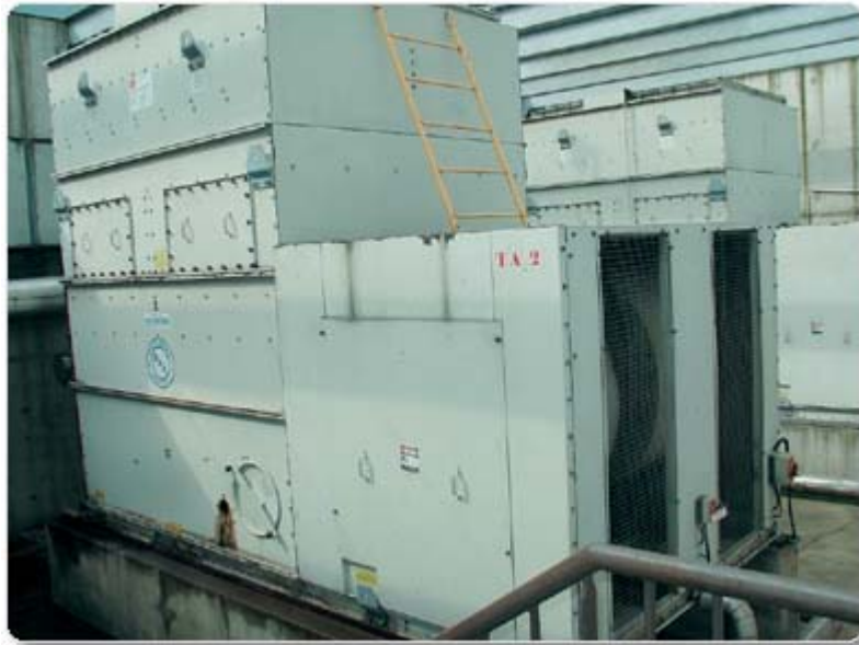
Рисунок 4. Градирни для охлаждения воды контура тепловых насосов

использовании приведенной в качестве примера системы кондиционирования воздуха, которая действительно используется в большинстве гостиниц Москвы. Но, как правило, возникают новые проблемы, такие как чрезмерное усложнение оборудования, увеличение его габаритов и необходимость больших площадей для размещения, применение более сложной и дорогостоящей автоматики. Или, скажем, можно отказаться вовсе от утилизации тепла, как и было сделано в одной новой небольшой гостинице в Москве.