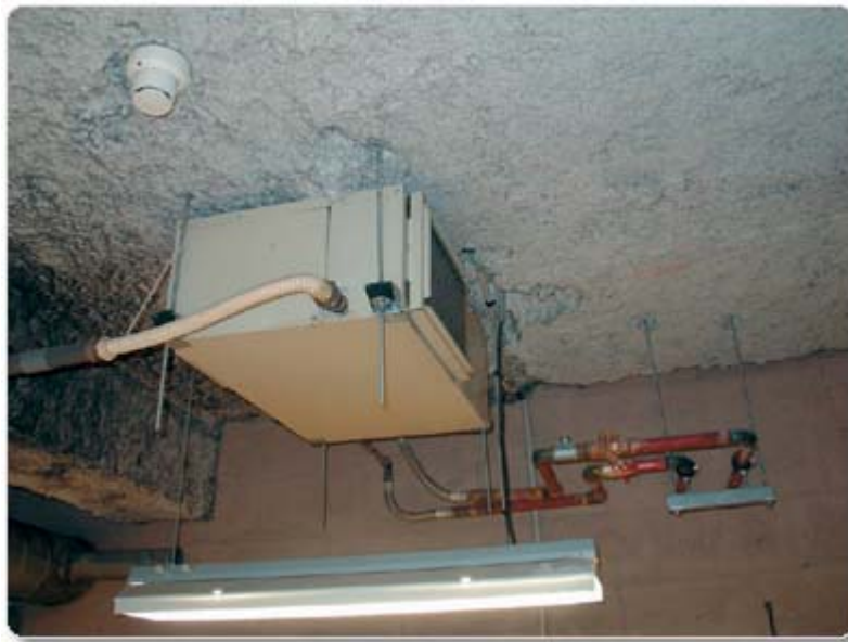
Рисунок 6. Подвесной тепловой насос меньшей производительности

При повышении температуры в контуре до 24 °С вода начинает циркулировать через градирню закрытого типа. Градирня оборудована системой орошения, двухскоростными вентиляторами и системой подогрева при отрицательной температуре наружного воздуха. При снижении температуры в контуре до 18 °С происходит добавка теплой воды из системы отопления предусмотренным для этого насосом. Нормальной температурой в контуре тепловых насосов и холодильников является температура от 18 до 32 °С, что, кстати, позволяет не использовать теплоизоляцию на трубах контура, а при обширности и большой разветвленности системы это является немаловажным фактором.