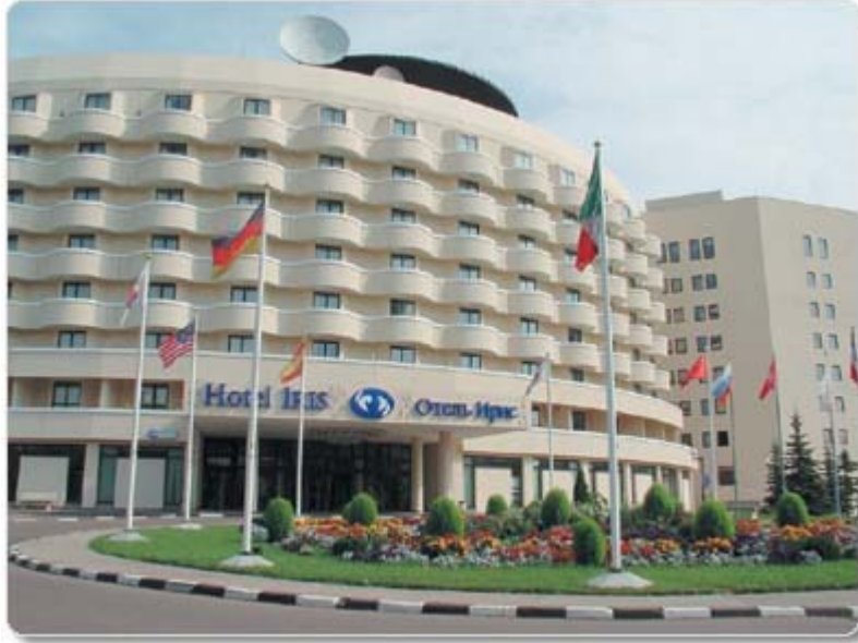
Рисунок 1. Гостиница «Ирис Конгресс Отель»

Гостиничные прачечная и химчистка, кухни, помещения тепловых пунктов, некоторые технические помещения, а также холодильные и морозильные камеры для хранения продуктов являются источниками большого количества тепла. В этих местах даже в зимнее время требуется охлаждение воздуха. В большинстве других помещений в зимние и частично в переходные периоды (весна и осень) в основном требуется обогрев. Естественным решением в этих условиях является использование того немалого количества тепла, отдаваемого перечисленными источниками, для обогрева прочих помещений в зимние и переходные периоды, продолжительность которых на широте Москвы составляет большую часть года.